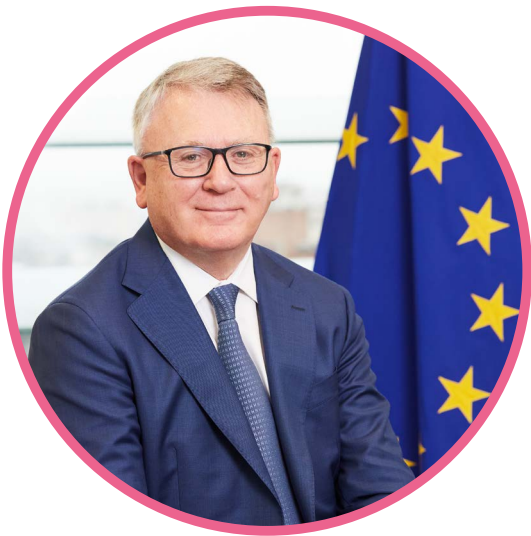
Nicolas Schmit, comisarul european pentru locuri de muncă și drepturi sociale

Europa trece printr-o perioadă de tranziție. Transformările ecologice și digitale sunt esențiale pentru un viitor durabil și aduc atât oportunități, cât și provocări. Ne propunem, de asemenea, să ieșim mai puternici din pandemia COVID-19, folosind această perioadă de transformare pentru a crea noi oportunități și locuri de muncă care să stimuleze redresarea Europei.