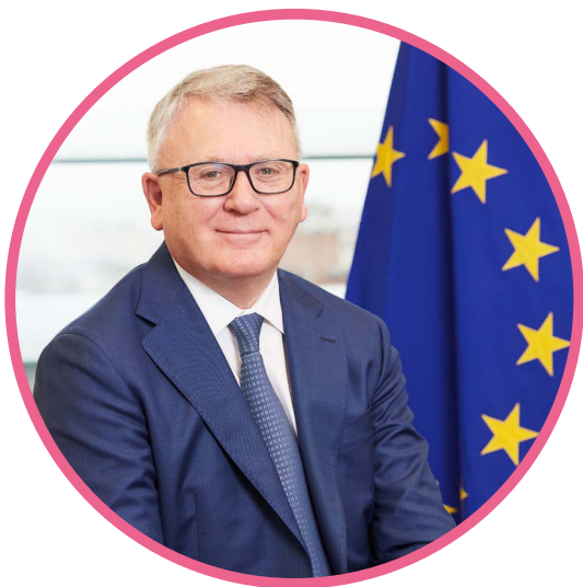
Никола Шмит, европейски комисар, отговарящ за работните места и социалните права

В Европа се намираме в период на преход. Зелената и цифровата трансформация са от съществено значение за устойчивото бъдеще и носят както възможности, така и предизвикателства. Стремим се също така да излезем по-силни от пандемията от COVID-19, като използваме този период на трансформация, за да създадем нови възможности и работни места и да стимулираме възстановяването на Европа.